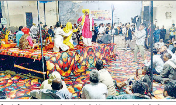
मंडी अटेली। सांस्कृतिक कार्यक्रम में प्रस्तुति देते कलाकार।