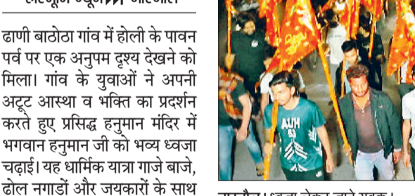
नारनौल। ध्वजा लेकर जाते युवाक।

ढाणी बाठोठा गांव में होली के पावन पर्व पर एक अनुपम दृश्य देखने को मिला। गांव के युवाओं ने अपनी अटूट आस्था व भक्ति का प्रदर्शन करते हुए प्रसिद्ध हनुमान मंदिर में भगवान हनुमान जी को भव्य ध्वजा चढ़ाई। यह धार्मिक यात्रा गाजे बाजे, ढोल नगाड़ों और जयकारों के साथ निकाली गई। जिसमें गांव के सैकड़ों युवा उत्साहपूर्वक शामिल हुए। युवाओं की यह पहल न केवल धार्मिक थी बल्कि सामुदायिक एकता और सकारात्मक ऊर्जा का भी प्रतीक बनी। होली के रंगों के बीच भगवान बजरंगबली के प्रति समर्पण ने पूरे गांव में भक्ति की