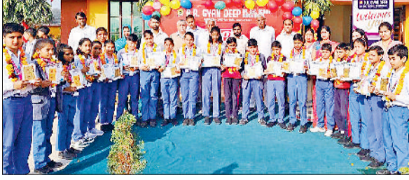
बीआर ज्ञानदीप विद्यालय में सम्मान हुआ समारोह