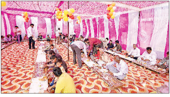
महेंद्रगढ़। भंडारे में प्रसाद ग्रहण करते हुए।