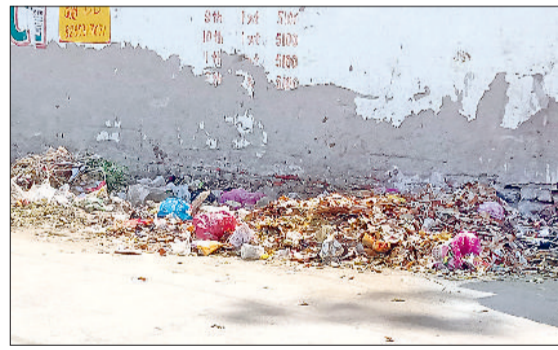
नारनौल। गवर्नमेंट गर्ल्स सीनियर सेकेंडरी की दीवार के साथ पड़ी गंदगी।

नियमित रूप से कूड़ा उठाने का दावा करने वाली नगर परिषद की व्यवस्था त्योहार के दौरान पूरी तरह से फेल हो गई है। लोगों ने बताया कि कई बार शिकायत करने के बावजूद भी कूड़ा उठाने के लिए कोई वाहन