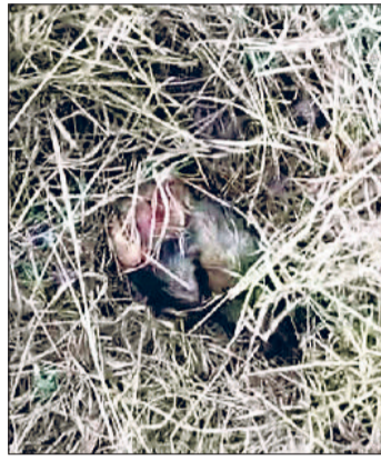
नारनौल। पहाड़ी के ऊपर पिछली साइड कुत्ते के शव व लगाया गया पिंजरा।

कुमार ने उसी दिन तुरंत प्रभाव से संबंधित सभी विभागों को सतर्क रहने और आवश्यक कार्रवाई करने के कड़े निर्देश जारी किए थे। वन विभाग व वन्यजीव विभाग की टीमों को भी तुरंत मोचों पर लगा दिया गया है। वन्यजीव निरीक्षक व डीएफओ को आदेश दिए गए हैं कि वे तेंदुए की लोकेशन को ट्रैक करें और उसे सुरक्षित तरीके से पकड़ने के लिए उचित रेस्क्यू ऑपरेशन शुरू करें। इसके साथ ही संबंधित एसडीएम को पूरी प्रक्रिया के दौरान विभिन्न विभागों के बीच बेहतर तालमेल सुनिश्चित करने की जिम्मेदारी सौंपी गई है। जिला विकास एवं पंचायत अधिकारी को निर्देश दिए गए हैं कि वे गांव के लोगों को सतर्क करें और पुलिस की मदद से गांव में ठीकरी पहरा शुरू करवाएं।