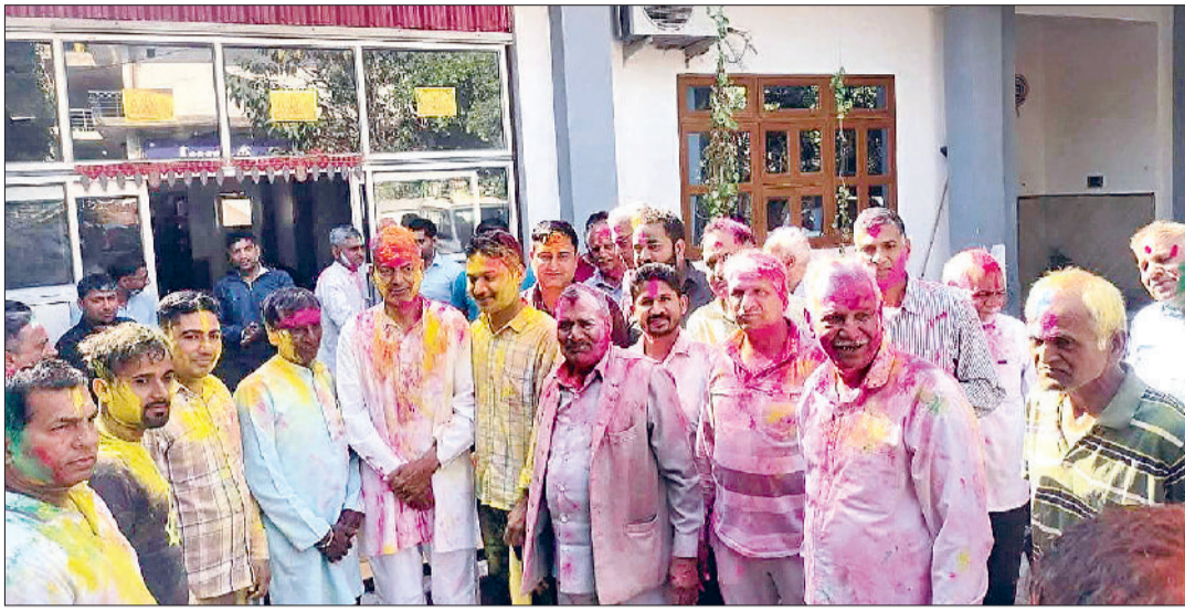
नारनौल। होली के रंगों में रंगे नजर आए गणमान्य नागरिक।

क्षेत्र में धुलंडी का पर्व पूरे हर्षोल्लास और उत्साह के साथ मनाया गया। सुबह होते ही शहर और आसपास के ग्रामीण क्षेत्रों में लोग रंगों में सराबोर नजर आए। बच्चे, युवा और महिलाएं एक-दूसरे को गुलाल लगाकर धुलंडी की शुभकामनाएं देते दिखाई दिए। शहर के विभिन्न मोहल्लों, कॉलोनियों और बाजारों में सुबह से ही रंगों की मस्ती शुरू हो गई थी। बच्चों ने पिचकारियों से रंग बरसाए, जबकि युवाओं की टोलियां ढोल और डीजे की धुन पर नाचते-गाते हुए एक-दूसरे को रंग लगाती नजर आईं। कई स्थानों पर युवाओं ने चौक-चौराहों और खाली मैदानों में डीजे लगाकर सामूहिक रूप से धुलंडी का उत्सव मनाया। इस दौरान युवक गुलाल उड़ाने हुए होली के गीतों पर जमकर थिरकते दिखाई दिए। महिलाओं ने भी उत्साह के साथ इस पर्व को मनाया। कई कॉलोनियों और मोहल्लों में महिलाओं ने एकत्र होकर एक-दूसरे को गुलाल लगाया और पारंपरिक गीतों के साथ होली की खुशियां साझा कीं। लोगों ने एक-दूसरे के घर जाकर मिठाइयां खिलाईं और पर्व की बधाई दी। ग्रामीण क्षेत्रों में भी धुलंडी की अलगा ही रौनक देखने को मिली। गांवों की चौपालों और गलियों में युवाओं की टोलियां ढोलक की थाप पर फाग गीत गाती नजर आईं। बुजुर्गों ने भी एक-दूसरे को गुलाल लगाकर आपसी भाईचारे और सौहार्द का संदेश दिया।