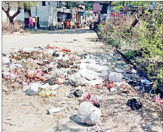
नारनौल। महल मोहल्ला में लगा गंदगी का ढेर व टीबी अस्पताल के कॉर्नर पर पड़ी गंदगी।

स्थानीय लोगों का कहना है कि कई स्थानों पर दो दिन नहीं, बल्कि चार-पांच दिनों से कूड़ा नहीं उठाया गया है। कूड़े के ढेरों में सड़ रहे कचरे के कारण वातावरण में बदबू फैल रही है और मक्खी-मच्छरों की भरमार हो गई है। लोगों को डर है कि यदि जल्द ही सफाई नहीं हुई तो डेंगू, मलेरिया और अन्य संक्रामक बीमारियों का खतरा बढ़ सकता है। मोहल्ला कैलाश नगर के निवासियों का कहना है कि