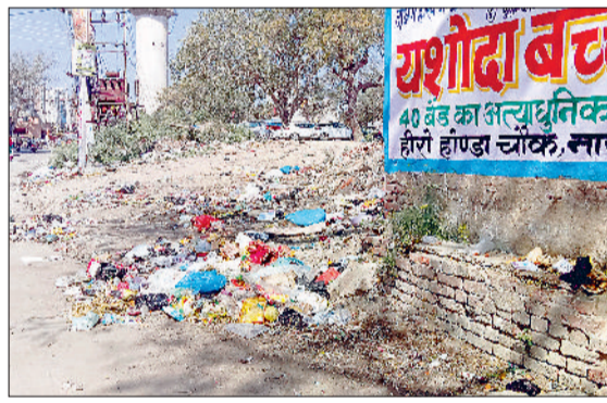
नारनौल। पुरानी कचहरी घड़ियों वाला बाबा पीर के पास पड़ी गंदगी।